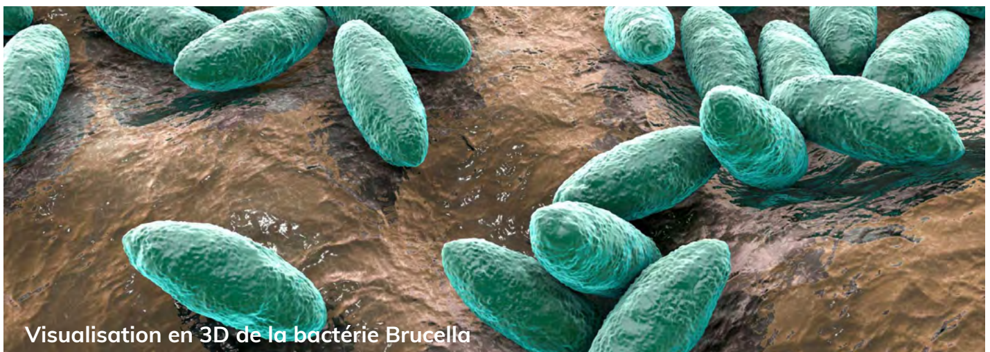
Visualisation en 3D de la bactérie Brucella

Des plans et des protocoles écrits, avec la participation d'un vétérinaire, sont mis en place et régulièrement mis à jour. Documents disponibles montrant la mise en application.